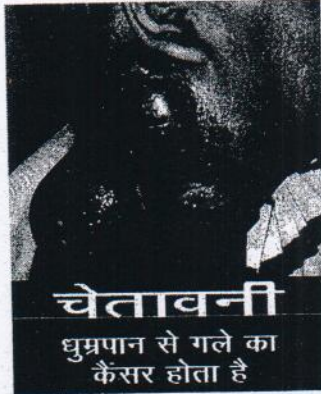
चित्र - 2

(ख) तम्बाकू उत्पादों के धूम्रपान रूपों वाले पैकेजों के लिए - चित्र (2) इन नियमों में सम्मिलित विनिर्दिष्ट स्वास्थ्य चेतावनी चित्र (1) की विनिर्दिष्ट स्वास्थ्य चेतावनी की आरंभ होने की तिथि से बारह माह समाप्त होने पर प्रभावी होगी।