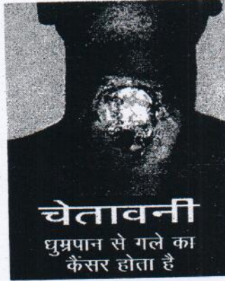
चित्र - 1

(ख) तम्बाकू उत्पादों के धूम्रपान रूपों वाले पैकेजों के लिए - चित्र (2) इन नियमों में सम्मिलित विनिर्दिष्ट स्वास्थ्य चेतावनी चित्र (1) की विनिर्दिष्ट स्वास्थ्य चेतावनी की आरंभ होने की तिथि से बारह माह समाप्त होने पर प्रभावी होगी।